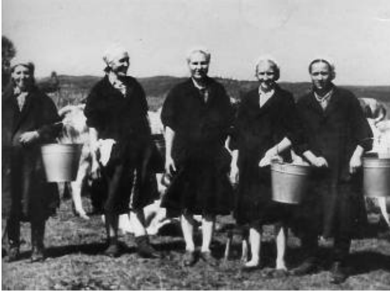
Мама на дойке (вторая слева)

- Ты хорошенько выдаивай, не поспешай, а то коровкам в жару трудно будет ходить. Они, почитай, все с отёла.